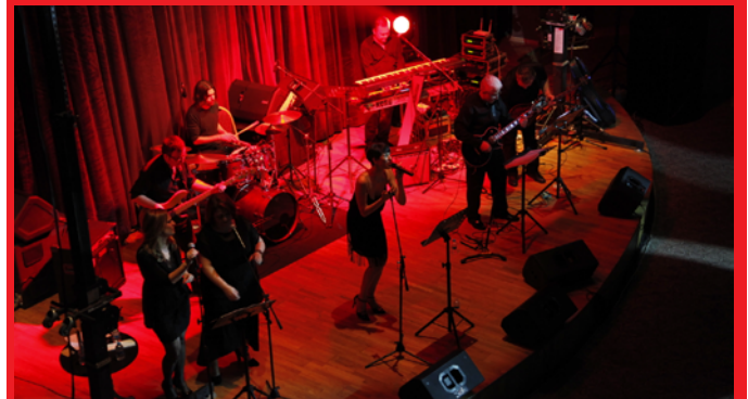
Grup Merdiven Altı