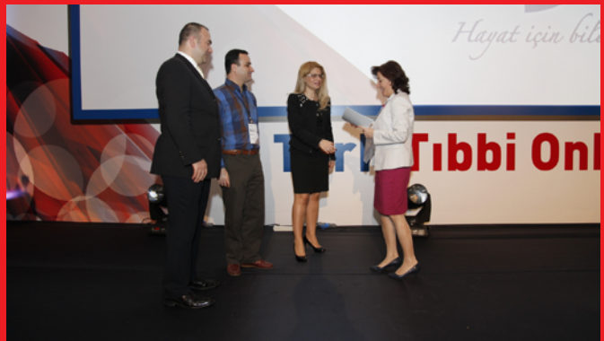
Resim: En iyi çalışma ödülleri oturumundan.