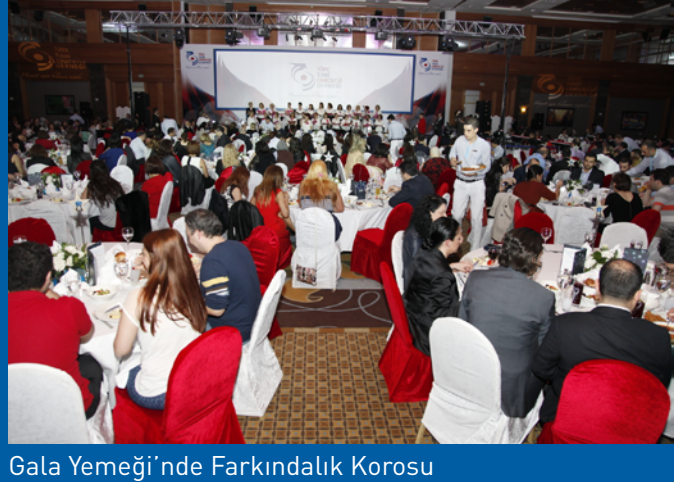
Gala Yemeği'nde Farkındalık Korusu