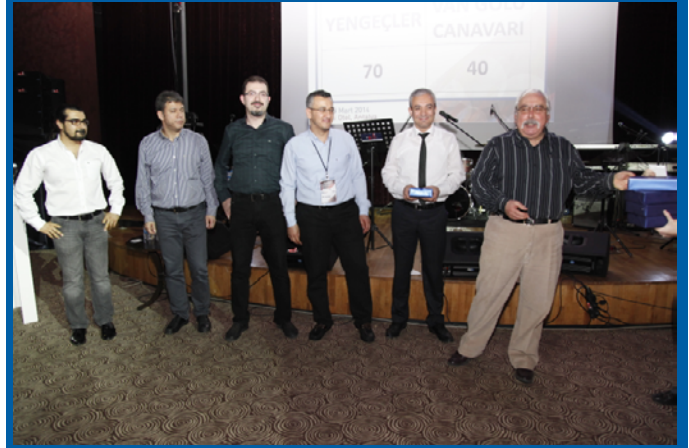
Onkologlar Yarışıyor'un kazananları