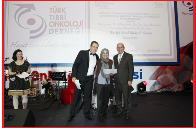
Gala Yemeği'nde sözel bildiri ödülleri