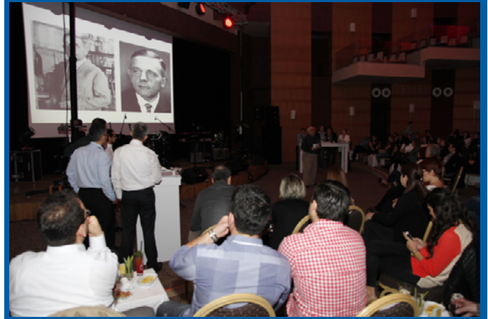
Onkologlar Yarışıyor yarışma anı