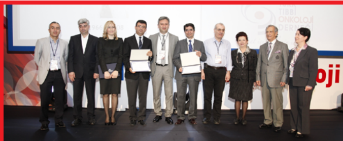
Mustafa Samur Tıbbi Onkoloji Araştırma Ödülleri

20 Mart Perşembe günü, kongre vaka sunumları, konferans, paneller, uydu sempozyumları ve sözel – poster bildirilerinin sunumlarıyla devam etti. Mustafa Samur Tıbbi Onkoloji Araştırma Ödülleri verildi.