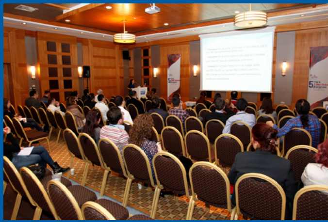
İlaç Etkileşimleri Kursu

Kongre 19 Mart Çarşamba günü kurslar ile başladı. Onkoloji hemşireliğinde temel kanser eğitimi, ilaç etkileşimleri kursu, hedefe yönelik ve yeni gelişen tedavilerde yan etki yönetimi, organ yetmezliklerinde tedavi yönetimi kursları yapıldı. Ben ilaç etkileşimleri kursuna katıldım ve gerçekten de çok faydalandım. Her gün çok sık kullandığımız kemoterapi ilaçlarının, hedefe yönelik ajanların diğer ilaçlarla etkileşiminden bahsedildi ve birçok konuda farkındalığımız arttı. Poliklinikte hasta bakarken günün yoğunluğu içerisinde bu önemli konuya daha fazla zaman ayırmamız gerektiğinin öz eleştirisini de yaptık.